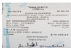
EMSA- MRS 12-23- Comprobante de transferencia.jpeg 35 KB

Investigador Adjunto CONICET Facultad de Ingeniería UNICEN, Olavarría Prof. Adj. Facultad de Agronomía UNICEN, AzulTE / FAX: +54-02284-451-055 int. 243CEL: +54-249-467 1515